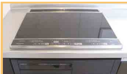
便利なIHクッキングヒーターは両面焼きのグリルも完備。ガラスのトップコートは掃除もラクラク。

キッチンバルコニーに無駄なく設置されたエコキュートのヒートポンプおよび貯湯ユニット。外壁になじむナチュラルな色で統一。